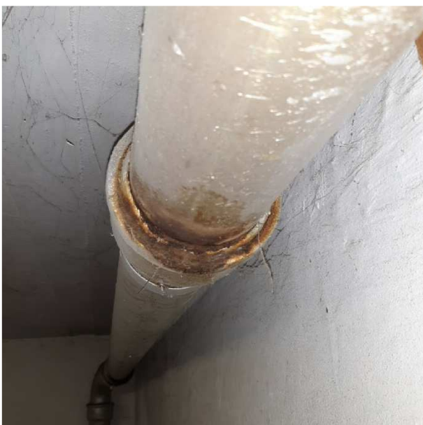
Samlingen er tæret.