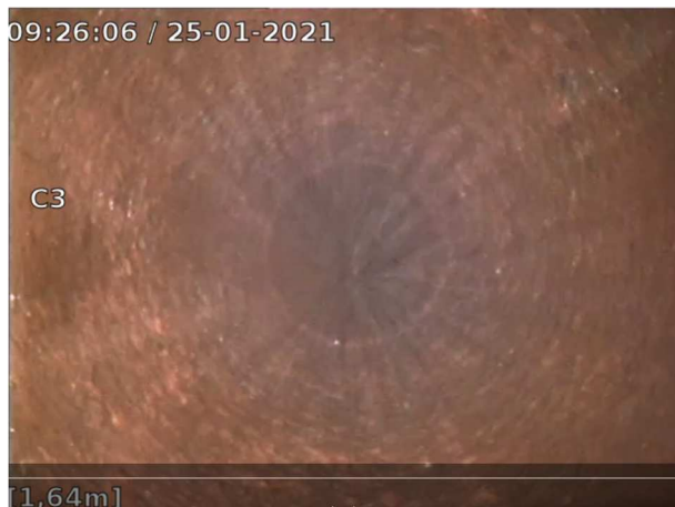
1,64 m nede i udluftningen af en faldstamme i nr. 26/28. Faldstammen fremstår tæret, men i ok stand.