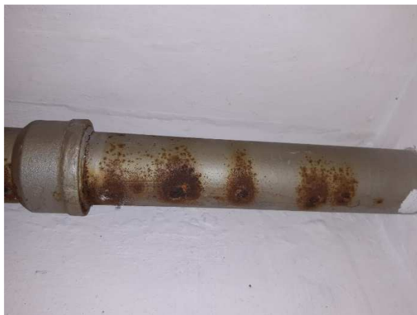
Der er synlige udposninger på faldstammen.