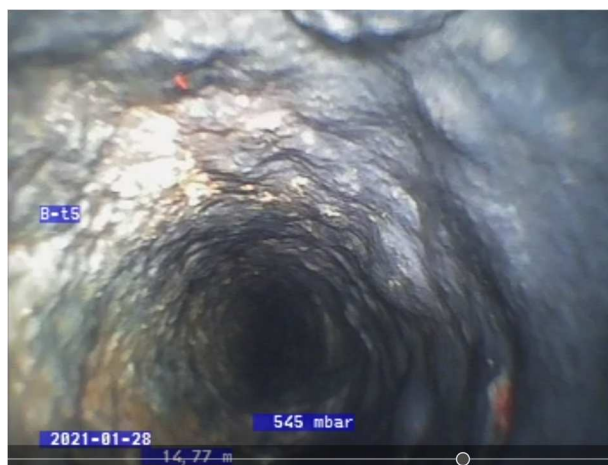
14,77 m nede i faldstamme i nr. 24. Diameteren på røret er reduceret pga. aflejringer.