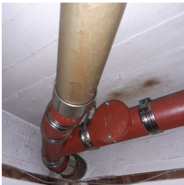
Grenrøret er udskiftet. Sandsynligvis pga. tæring.