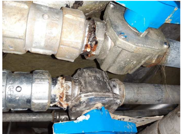
Tærede samlinger på vandrør.