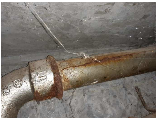
Faldstammen er revnet.