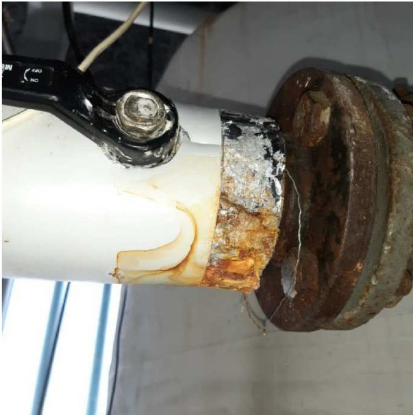
Tæret samling i varmecentral.