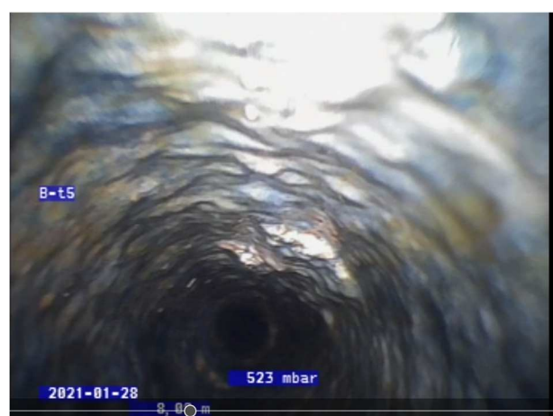
8,05 m nede i faldstamme i nr. 24. Der ses tydelige indsnævninger pga. aflejringer.