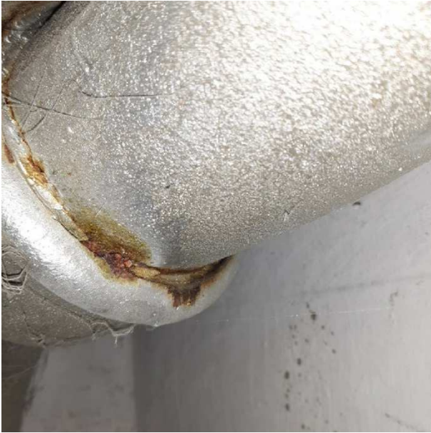
Samlingen er tæret.