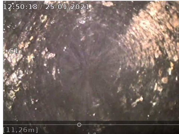
11,26 m nede i faldstamme i nr. 26/28. Faldstammen fremstår tæret og meget ru. Der kan på videoen ses store rustflager, der falder af.