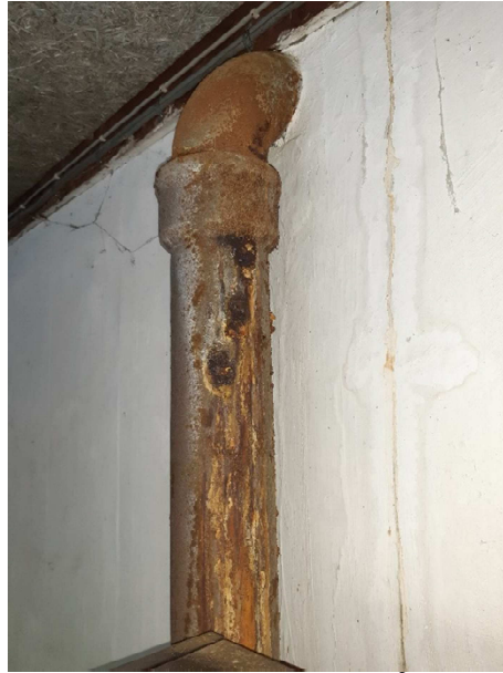
Der er synlige udposninger på faldstammen.