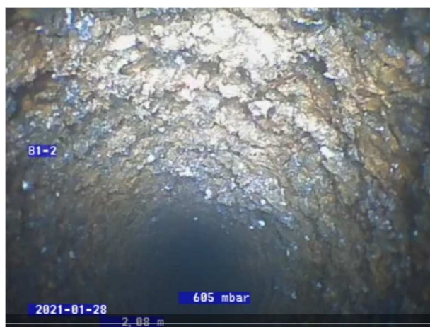
2,08 m nede i faldstamme i nr. 24. Faldstammen fremstår tæret og meget ru.