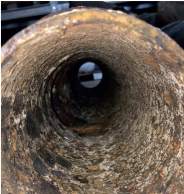
Eksempel på en perfekt rensed faldstamme.