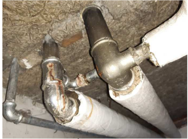
Tærede samlinger på vandrør.