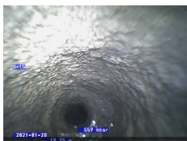
19,75 m nede i faldstamme i nr. 24. Diameteren på røret er halveret pga. aflejringer.