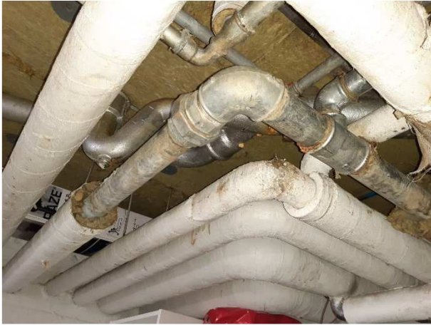
Vand og varme ligger under tærede afløbsrør i stue/kælder.