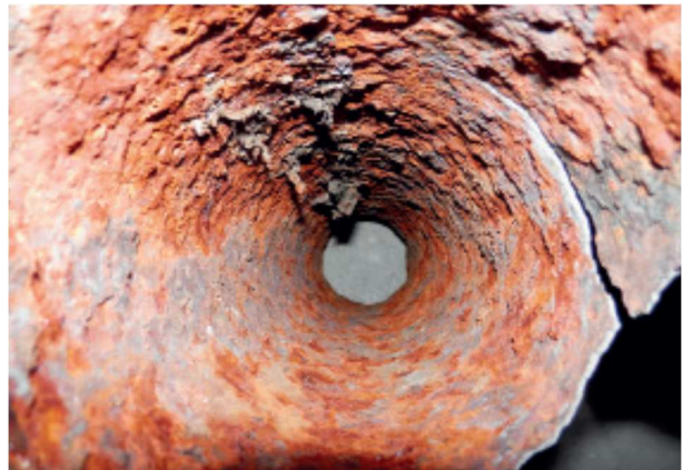
Eksempel på faldstamme der er flækket under mekanisk rensning, grundet dårlig stand.